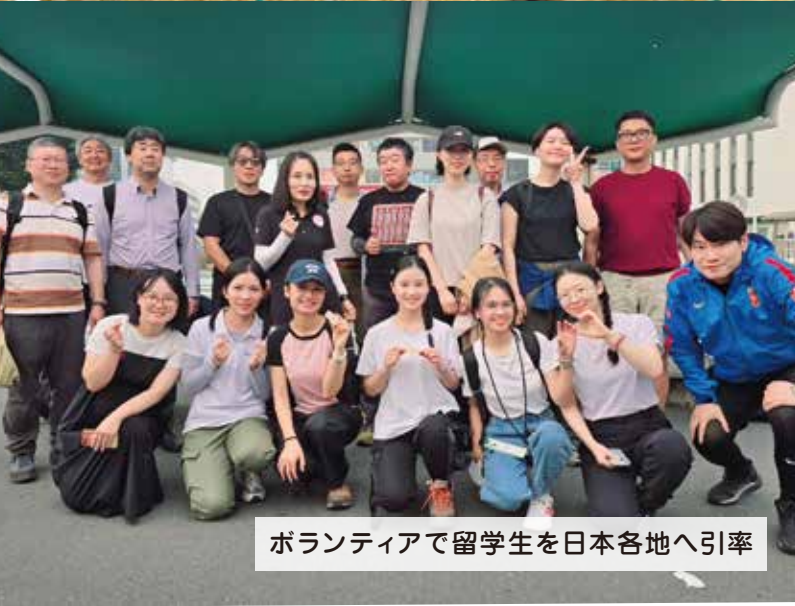
ボランティアで留学生を日本各地へ引率