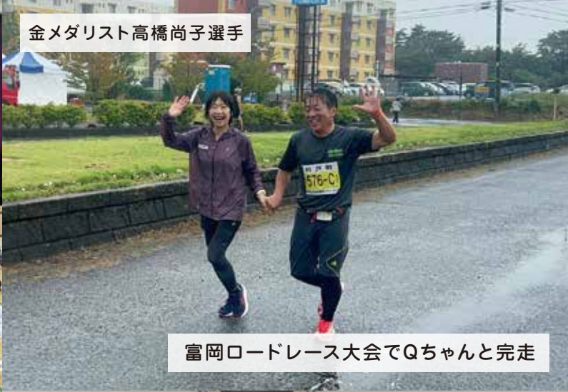
富岡ロードレース大会でQちゃんと完走