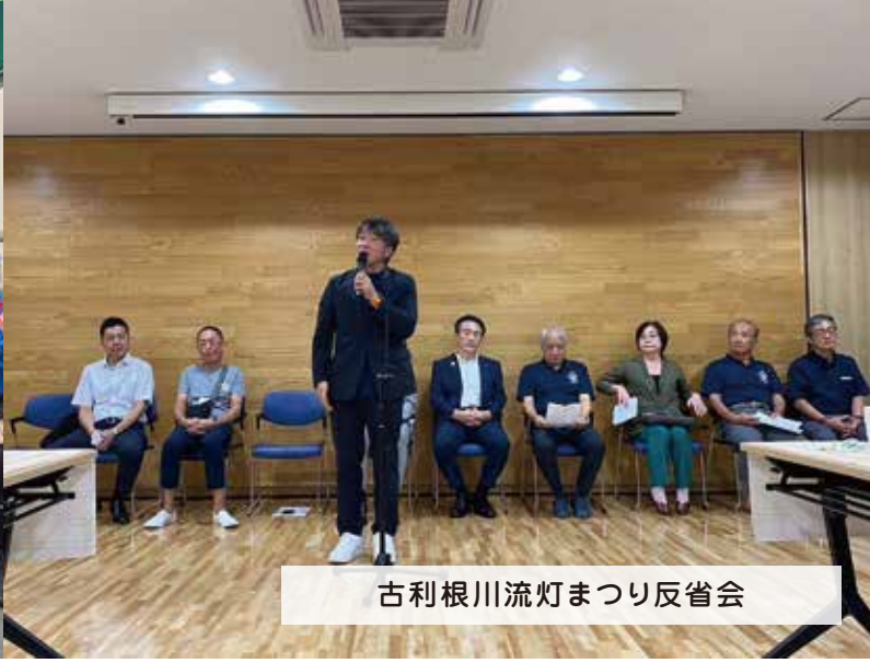
古利根川流灯まつり反省会