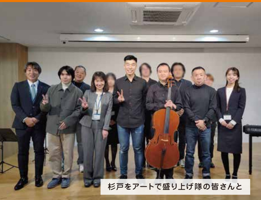
杉戸をアートで盛り上げ隊の皆さんと