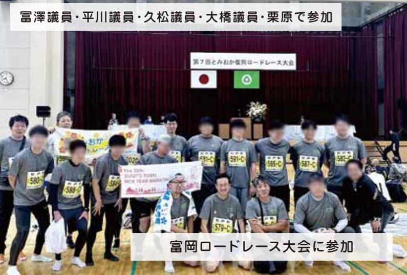
富岡ロードレース大会に参加